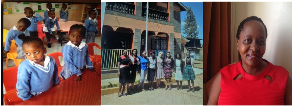
Obr. 6 Návšteva základnej školy Kamahia Primary School