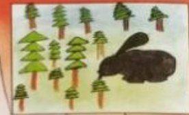
Vilko Hlaváček, ZŠ Uhorská

- Po cestičke srnka kráča, do lesa sa cesta stáča. Zbadá zajka, rýchlo háda,