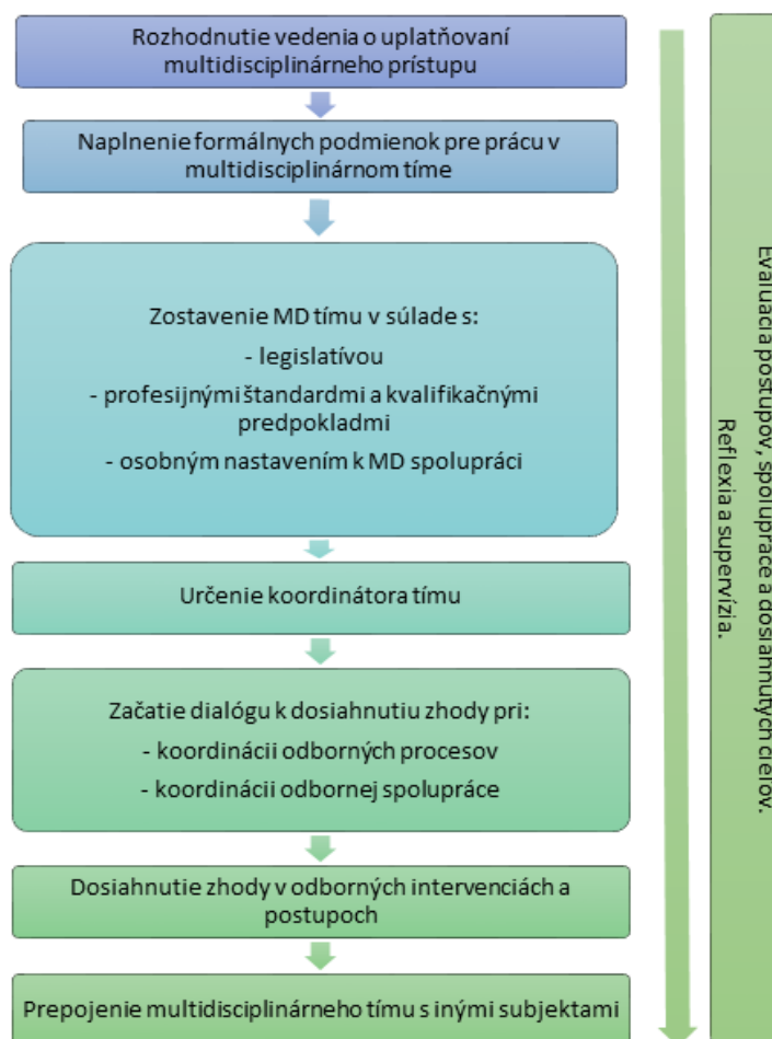
Tabuľka 1: Schéma tvorby multidisciplinárneho tímu

Postup utvárania multidisciplinárneho tímu sa úzko spája s napĺňaním všetkých krokov a predpokladov, opísaných v predchádzajúcom texte - počnúc od osobného nastavenia jednotlivých členov, zabezpečenia formálnych predpokladov pre prácu v multidisciplinárnom tíme, koordinácie odborných postupov až po koordináciu vzájomnej spolupráce. Špecifiká organizácie môžu priniesť odlišný postup pri napĺňaní jednotlivých krokov, napríklad ich paralelný sled či prelínanie. Niektoré kroky sú zároveň predpokladmi pre prehlbovanie spolupráce a je prínosom, ak sa uplatňujú počas celého procesu vzniku multidisciplinárneho tímu, ako napríklad evalvácia, reflexia. Nasledujúca schéma pomenúva kľúčové míľniky pri tvorbe multidisciplinárneho tímu.