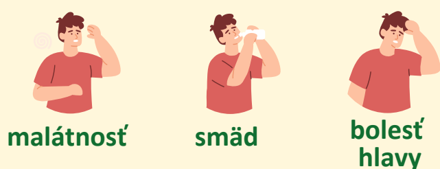
malátnosť smäd bolesť hlavy