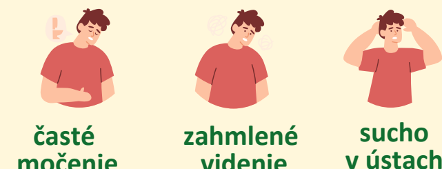
časté močenie zahmlené videnie sucho v ústach